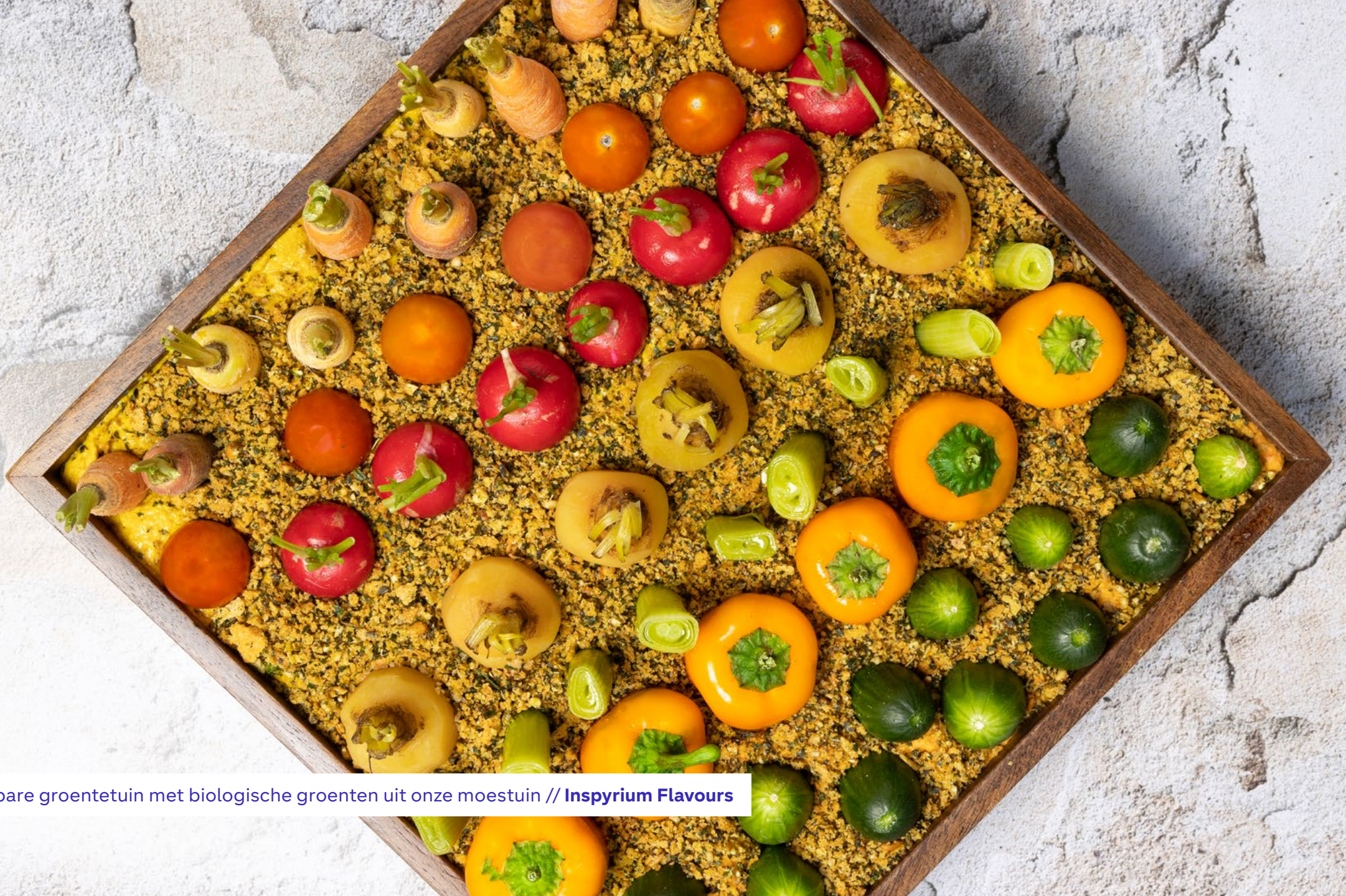
Eetbare groentetuin met biologische groenten uit onze moestuin // Inspyrium Flavours