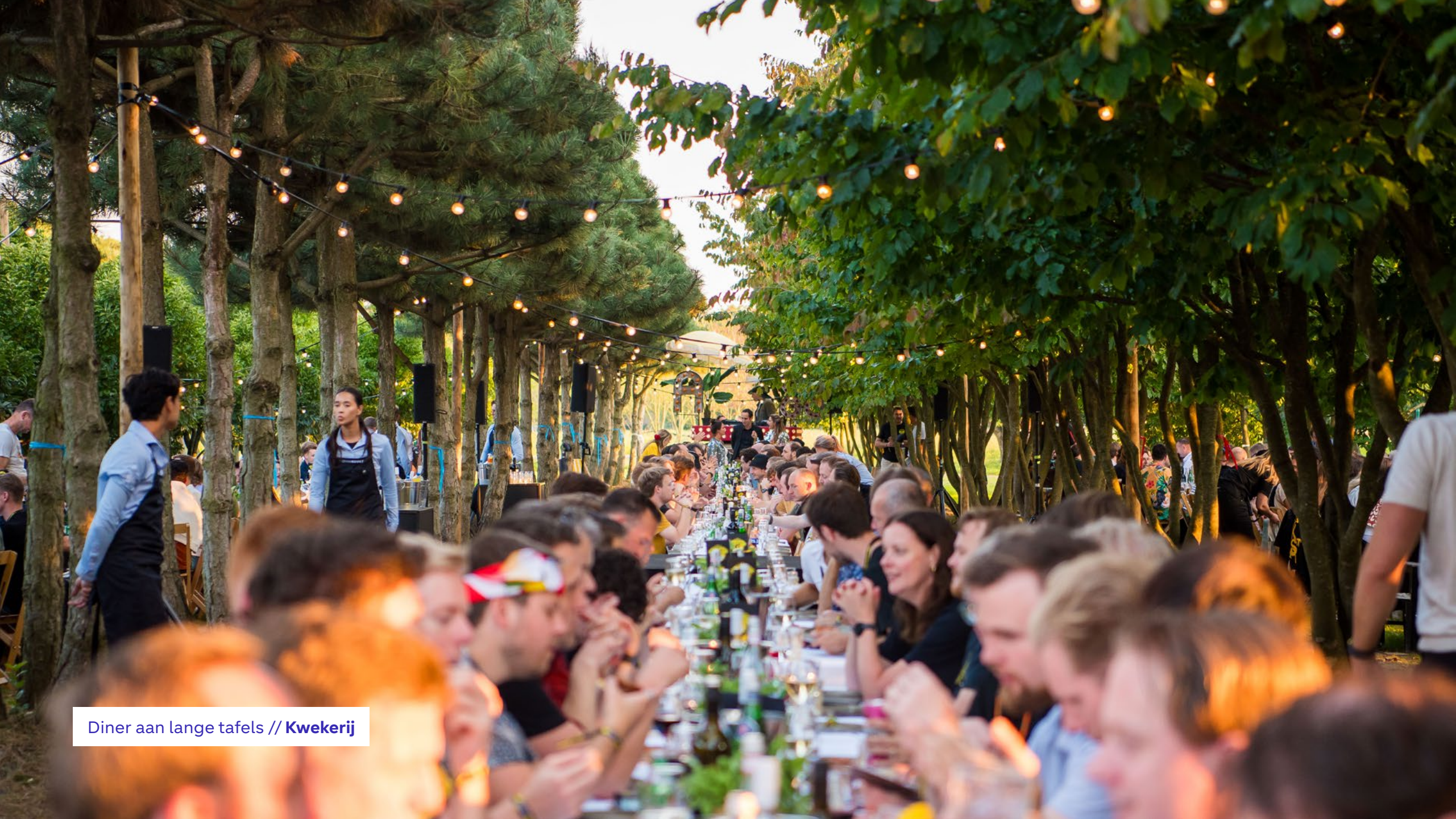
Diner aan lange tafels // Kwekerij