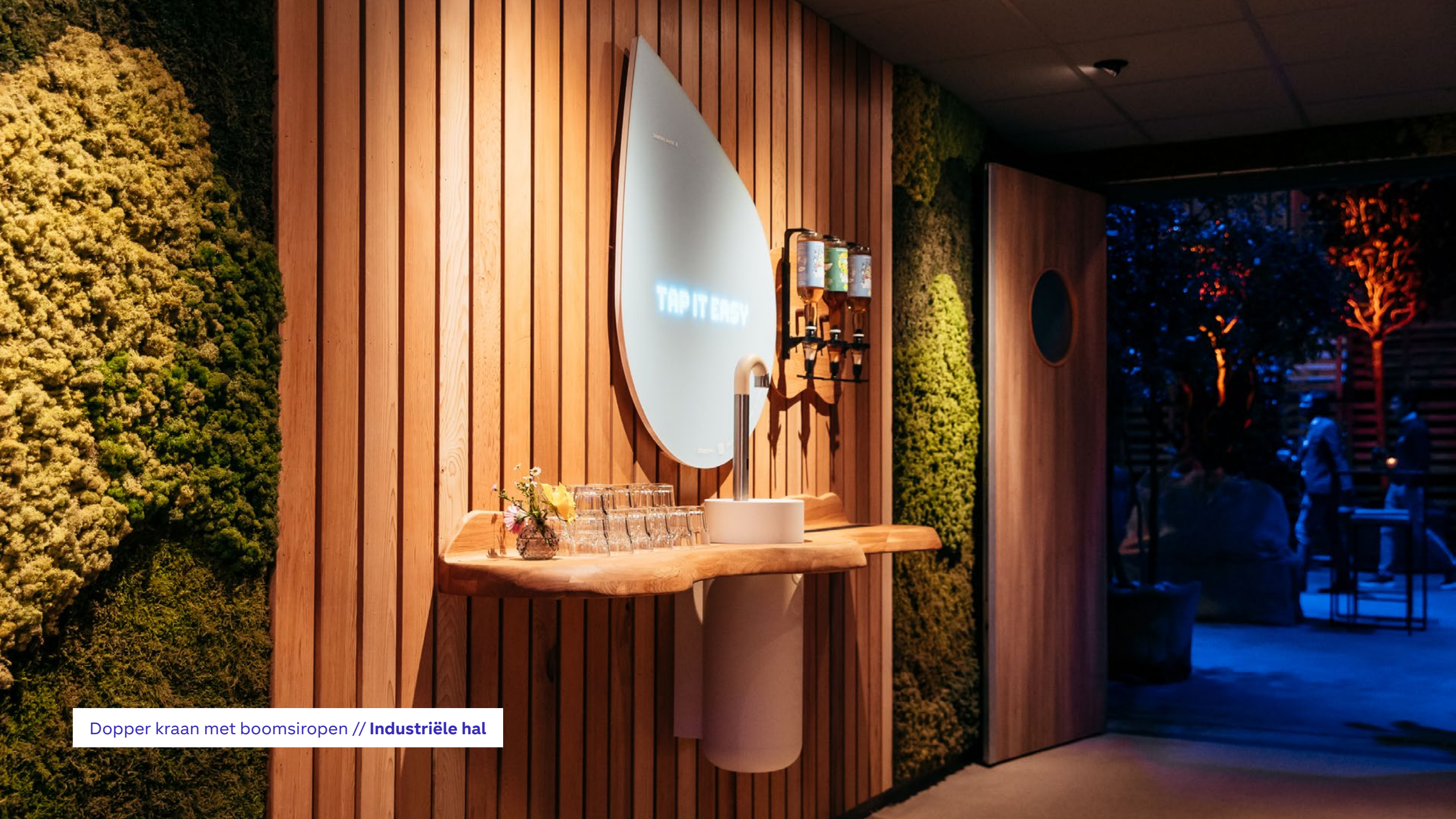
Dopper kraan met boomsiropen // Industriële hal